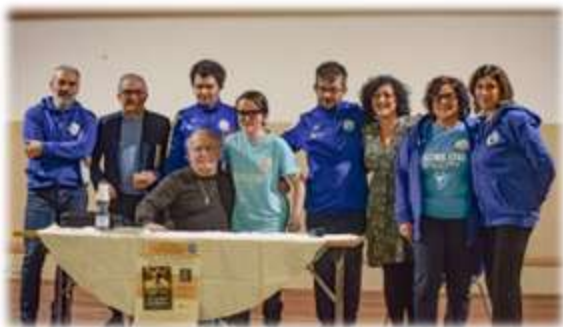
Presentazione del libro "Un amore di troppo" di Nino Rossi